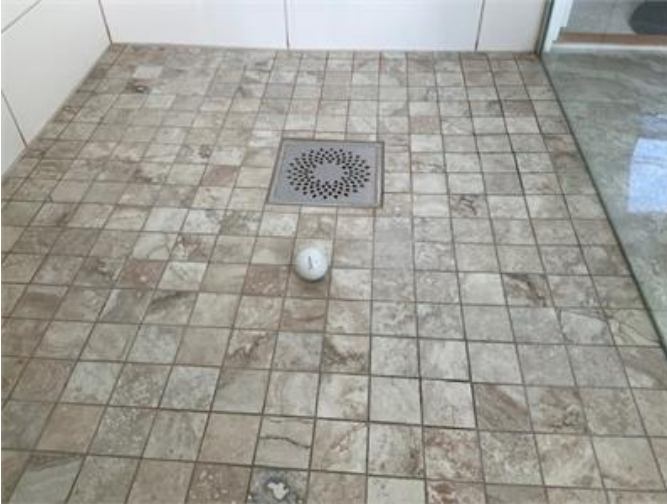
Bristfälligt golvfall i dusch/WC övre plan.