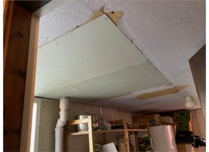
Innertak i garage/förråd. Inte färdigställt efter åtgärd. Endast kosmetisk betydelse.